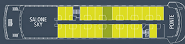
4° PONTE CABO DE HORNOS ■ AAA (23) ■ AAA SUPERIOR (2)