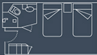
CABINE STANDARD TWIN 16,5 m 2 / 177 ft 2

CAPACITÀ PASSEGGERI: 200 TOTALE CABINE: 100