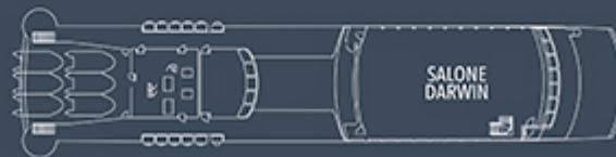
5° PONTE DARWIN