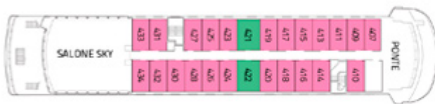
PONTE CAPO HORN AAA AAA Superior