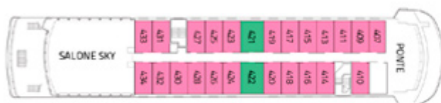
PONTE CAPO HORN AAA AAA Superior