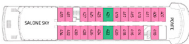
PONTE CAPO HORN AAA AAA Superior