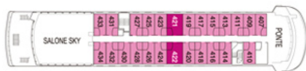
PONTE CAPO HORN AAA AAA Sup