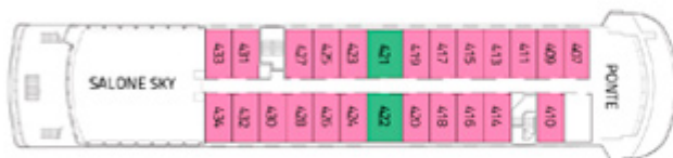
PONTE CAPO HORN