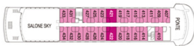
PONTE CAPO HORN AAA AAA Sup