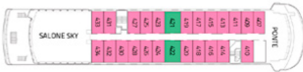
PONTE CAPO HORN