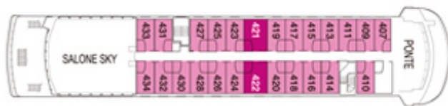
PONTE CAPO HORN AAA AAA Sup