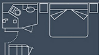
CABINE STANDARD MATRIMONIALE 16,5 m 2 / 177 ft 2