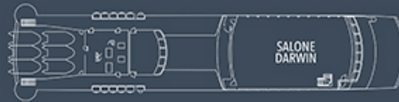
5° PONTE DARWIN