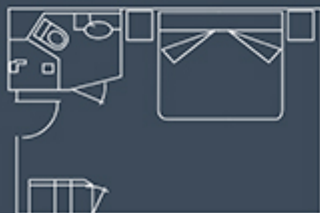
CABINE SUPERIOR MATRIMONIALE 20,5 m 2 / 220 ft 2