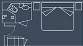
CABINE STANDARD MATRIMONIALE 16,5 m 2 / 177 ft 2