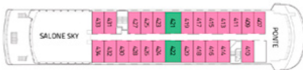
PONTE CAPO HORN AAA AAA Superior