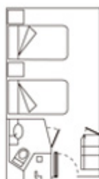
Plantina della Cabina Standard 16,5 m 2 / 177 sq.ft. Superior 20,5 m 2 / 220 sq.ft.