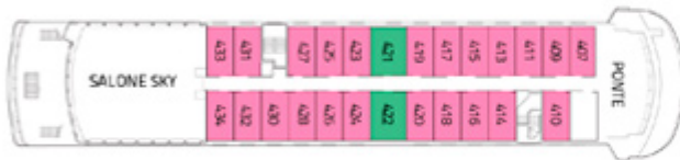
PONTE CAPO HORN AAA AAA Superior