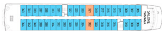
PONTE TERRA DEL FUOCO AA AA Superior