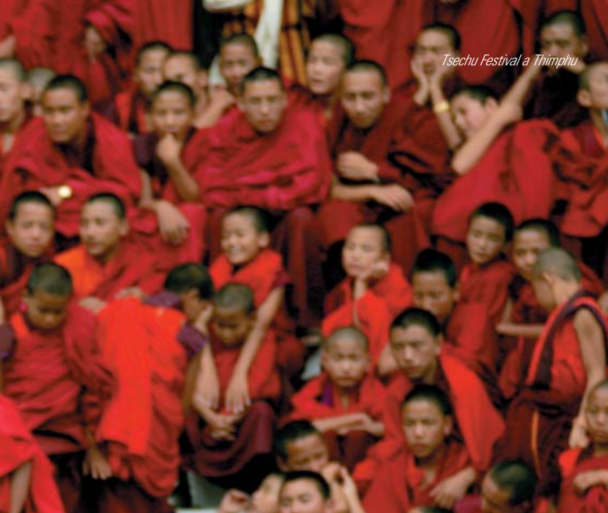
Tsechu Festival a Thimphu