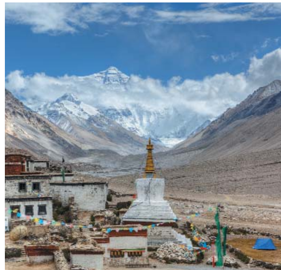
Monastero di Rongbuk (5150 m-slm) al campo base dell'Everest

Tutte le tasse aeroportuali - Visto d'ingresso in Nepal - Pasti non indicati, bevande, mance e tutto quanto non specificato.