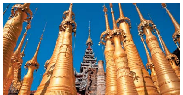
Le mille pagode sulle colline di Inthein (XIII Sec.) a sud del Lago Inle

Tutte le tasse aeroportuali (Tassa d'imbarco a Yangon USD 10, da riconfermare) - Visto d'ingresso in Myanmar - Pasti non indicati, bevande, mance e tutto quanto non sopra specificato.