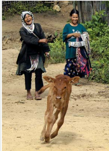
Passeggiata a Kengtong tra i villaggi Akha