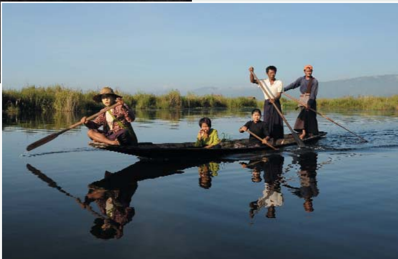
L'avvolgente atmosfera del Lago Inle

sulla sponda occidentale dell'Ayeyarwady. Nel pomeriggio escursione in barca all'antica città reale di Mingun per visitare la grande pagoda incompiuta, la Campana da 90 tonnellate e la pagoda di Settawya con le impronte dei piedi di Buddha. Rientro a Mandalay, cena e pernottamento.