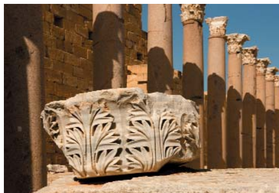
Capitello corinzio nelle rovine della città romana di Leptis Magna

Visto d'ingresso in Libia - Tutte le tasse aeroportuali - Pasti non indicati, bevande, mance e tutto quanto non espressamente indicato.