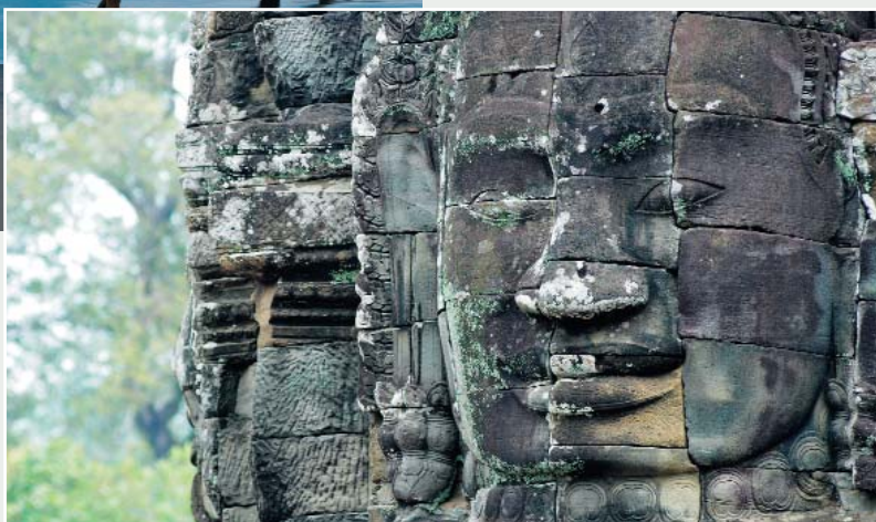
Particolare di un Tempio di Angkor