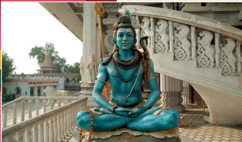
Lord Shiva al tempio di Chattapur - New Delhi