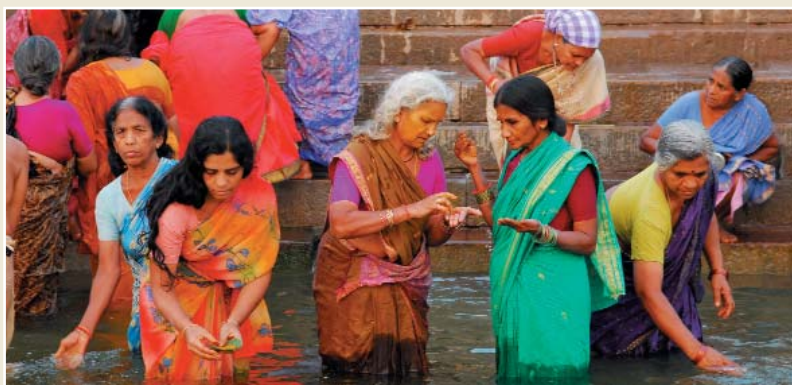
Cerimonia di purificazioni ai ghat di Varanasi