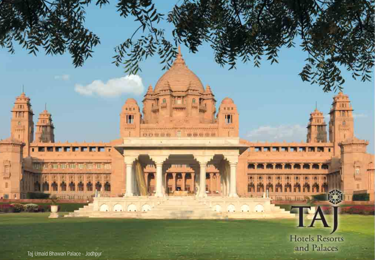
Taj Umaid Bhawan Palace - Jodhpur