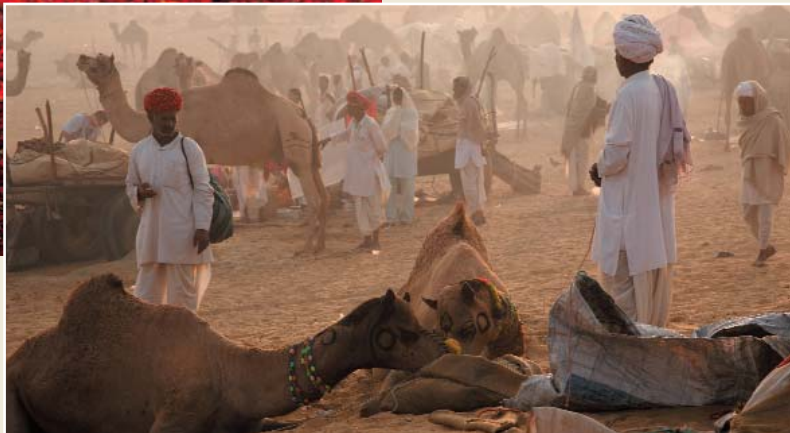
Festival di Pushkar