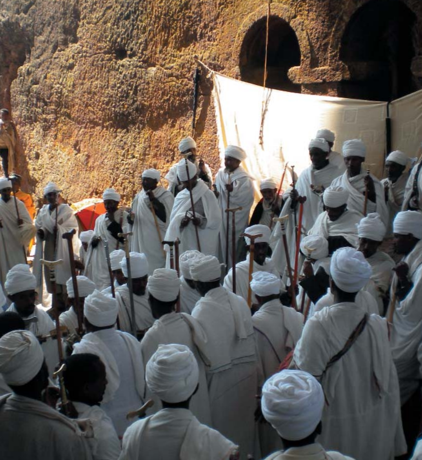
Funzione religiosa copta alla chiesa di Bette Maryam - Lalibela