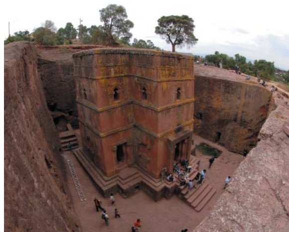
Panoramica della chiesa copta di San Giorgio - Lalibela

Tutte le tasse aeroportuali - Visto d'ingresso - Escursioni e visite facoltative - Pasti non indicati, bevande, mance e tutto quanto non sopra specificato.