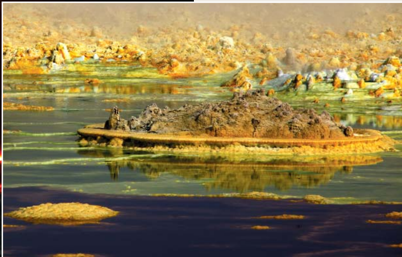
L'inimmaginabile scenario della collina del Dalol